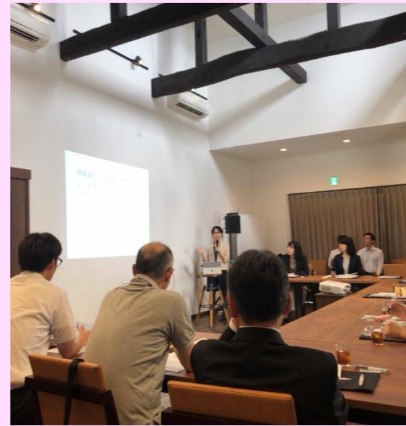
▲ セミナー会場の様子