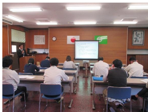
▲ 川内村さまにおける研修会実施の様子（平成30年2月）

また、サービスプランは自治体さまのご要望に応じて決定します。まずはお気軽にお問い合わせください。（相談無料）